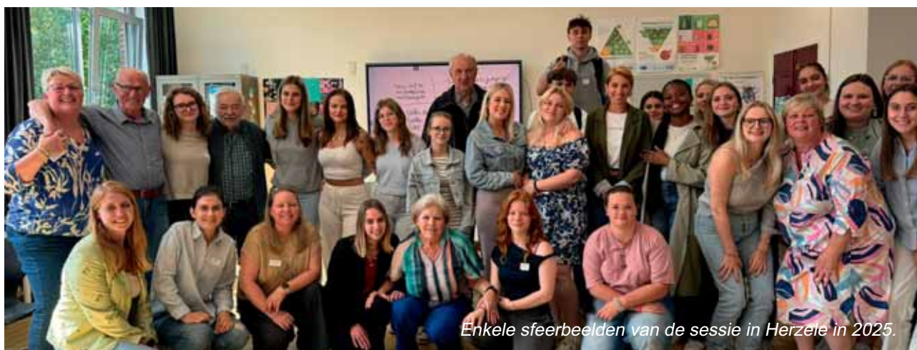
Enkele sfeerbeelden van de sessie in Herzele in 2025.

Binnen Vief krijgen deze inzichten vorm in het project Gensconnect, waar jong en oud met elkaar in gesprek gaan. Die ontmoetingen tonen hoe waardevol het is wanneer generaties elkaar echt beluisteren en leren van elkaars ervaringen en levensverhalen.