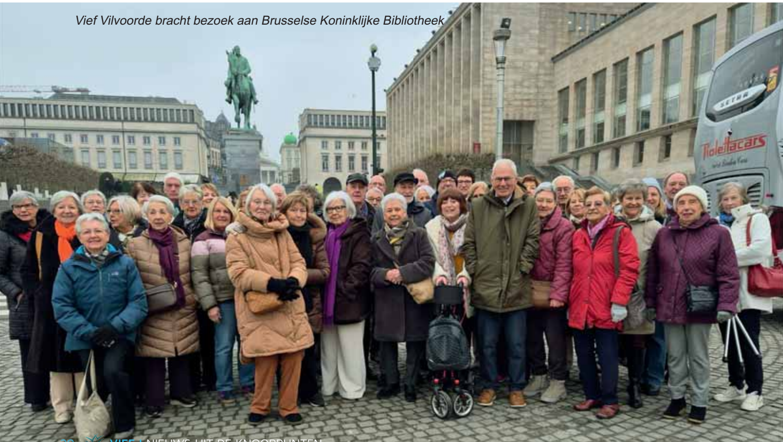
Vief Vilvoorde bracht bezoek aan Brusselse Koninklijke Bibliotheek

Vief Vilvoorde bezocht de Koninklijke Bibliotheek van België. Ze genoten eerst van het culinaire gedeelte bij "Albert" op de 5e verdieping. Daarna volgde het culturele bezoek aan het museum over de Bourgondiërs en de prachtige Nassaukapel.